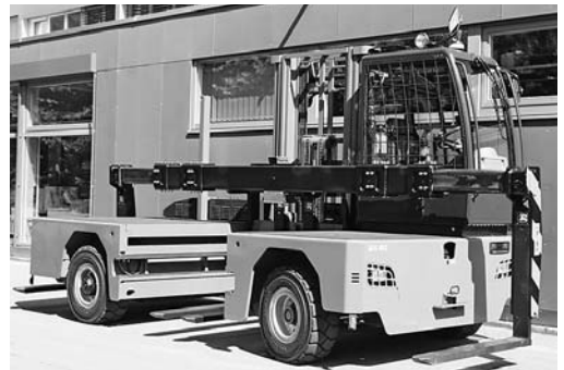
4 Einsatz eines Seitenstaplers mit Langguttraverse zum Transport von langen Werkstücken (Bau- und Konstruktionsholz, Rohre usw.).