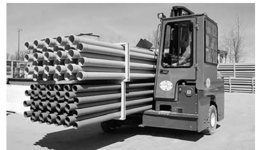
5 Die Rohre sind mit Holzrahmen und Stahlbändern gesichert. So können sie mit dem Vierwegstapler sicher transportiert und eingelagert werden.