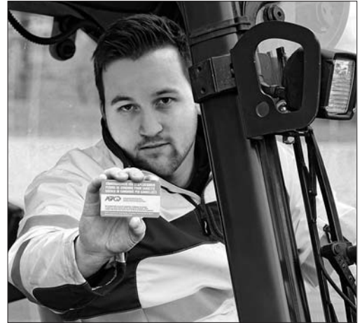
1 Wer einen Seitenstapler fährt, muss eine Ausbildungsbestätigung der Kategorie R3 vorweisen können. Die Stapler-Kategorien und die Anforderungen an die Ausbildung und die Instruktion für Bediener sind in der Richtlinie EKAS 6518 definiert.