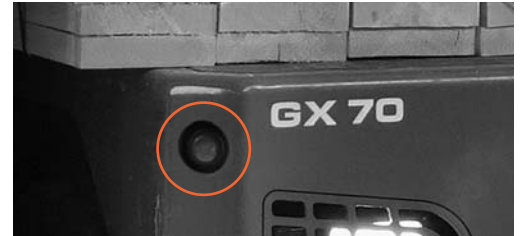
6 Kamera vorne rechts eingebaut