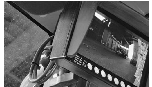
8 Monitor mit Bild der Kamera vorne rechts bei eingelegetem Vorwärtsgang