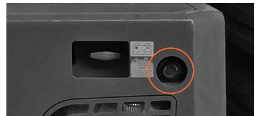
7 Kamera am Heck eingebaut